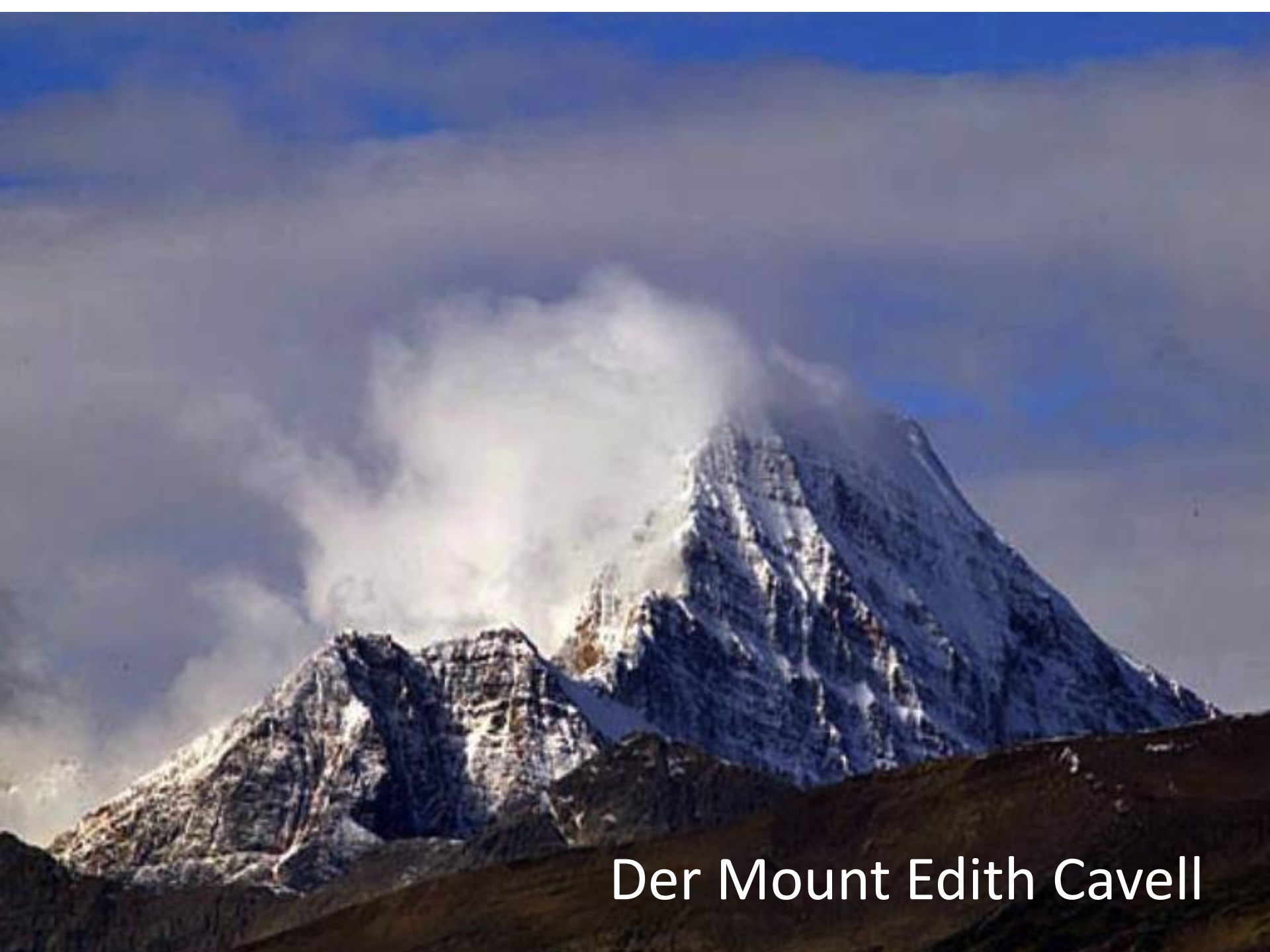
Der Mount Edith Cavell